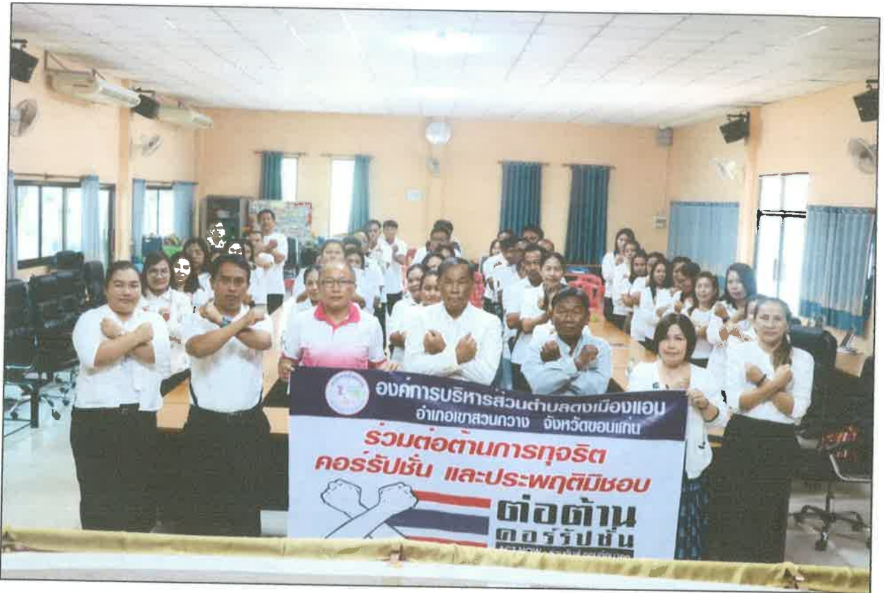
ภาพกิจกรรมการประกาศเจตนารมณ์เนื่องในโอกาสวันต่อต้านคอร์รัปชันสากล (ประเทศไทย)