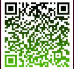
ประกาศฯ ฉบับเต็มที่นี่